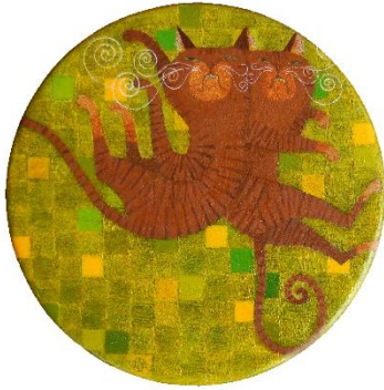
『TWINs -鶯色-』(2016年) 直径150mm円板に綿布・白亜地・油彩・テンペラ

5. 講師 奥秋 由美 先生 (跡見学園女子大学 非常勤講師・横浜美術大学 非常勤講師)