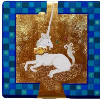
『獅猛の瓶詰』(2018年) 130×130mm板に麻布・石膏地・テンペラ・金箔

1995年 東京芸術大学美術学部絵画油絵専攻卒業 《O氏記念賞》《台東区長賞》 1997年 東京芸術大学大学院美術研究修士課程絵画専攻卒業 現在 跡見学園女子大学 非常勤講師、 多摩美術大学 非常勤講師、 Atelier LAPIS 講師