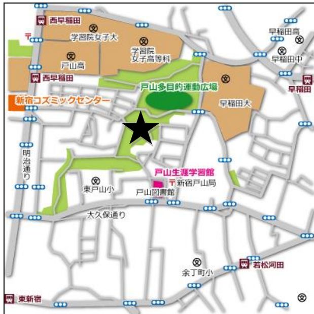
<解散予定場所(★印付近)案内図>

副都心線「西早稲田駅」 徒歩12分 副都心線「東新宿駅」 徒歩13分 大江戸線「若松河田駅」 徒歩15分 東西線「早稲田駅」 徒歩17分