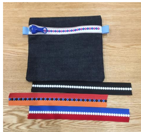
②ビーズファスナーポーチ見本作品