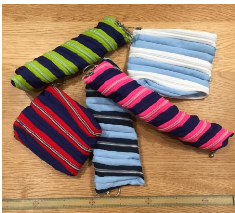
①ファスナーポーチ見本作品