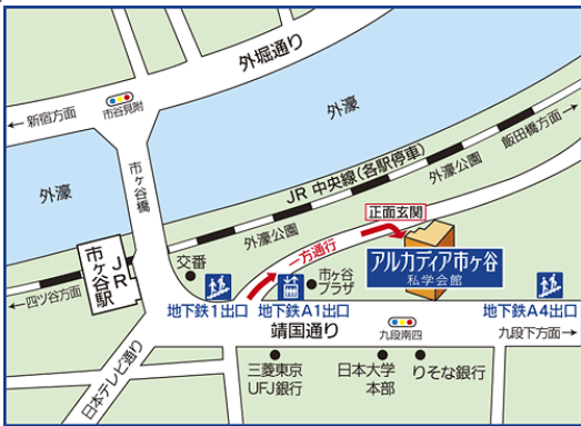
アルカディア市ヶ谷(私学会館)案内図 JR・地下鉄「市ヶ谷駅」徒歩3分